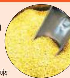
सरकारी प्रवक्ता ने बताया कि धान (कॉम) का न्यूनतम समर्थन मूल्य 2,040 रुपये प्रति क्विंटल से बढ़ाकर 2,183 रुपये प्रति क्विंटल कर दिया गया है। जबकि ए-ग्रेड धान का एमएसपी 2,060 रुपये प्रति क्विंटल से बढ़ाकर 2,203 रुपये प्रति क्विंटल किया गया है। मूंग दाल के मूल्य में भी उल्लेखनीय वृद्धि की गई है, इसका एमएसपी 7,755 रुपये प्रति क्विंटल से बढ़ाकर 8,558 रुपये प्रति क्विंटल कर दिया गया है।

टीम एक्शन इंडिया/वडीगढ़ प्रधानमंत्री नरेंद्र मोदी की अध्यक्षता में आज नई दिल्ली में हुई केंद्रीय मंत्रिमंडल की बैठक में विपणन सौजन 2023-24 के लिए खरीफ फसलों के न्यूनतम समर्थन मूल्य में बढ़ोतरी करने के निर्णय के लिए हरियाणा के मुख्यमंत्री मनोहर लाल ने प्रधानमंत्री नरेंद्र मोदी का आभार व्यक्त किया है। यह निर्णय किसानों की आय दोगुनी करने की सरकार की वनबद्धता की दिशा में एक और कदम है। इस बारे में