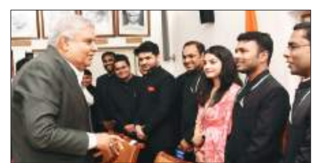
टीम एक्शन इंडिया/नई दिल्ली

उपराष्ट्रपति जगदीप धनखड़ ने अपने आवास पर इंडियन डिफेंस एस्टेट सर्विसेज के अफसरों को संबोधित किया। यहाँ उन्होंने कहा कि हमें रियर व्यू मिरर में देखना चाहिए, इसमें देखकर उन लोगों को नोटिस करना चाहिए जो देश के संस्थानों को कलकित और नष्ट कर रहे हैं। उपराष्ट्रपति के इस संबोधन को राहुल गांधी के बयान पर तंज माना जा रहा है। दरअसल, राहुल गांधी ने रविवार को अमेरिका में कहा था कि पीएम मोदी देश की गाड़ी को रियर व्यू मिरर देखकर चला रहे हैं। वे सिर्फ पीछे की तरफ देख रहे हैं और फिर हैरान हो रहे हैं कि हादसे पर हादसे क्यों हो रहे हैं। अफसरों से कहा- कुछ लोग देश पर गर्व नहीं करते: उपराष्ट्रपति ने अफसरों से कहा कि उपरान्त कि रियर व्यू मिरर में देखने के बाद आप जान पाएंगे कि