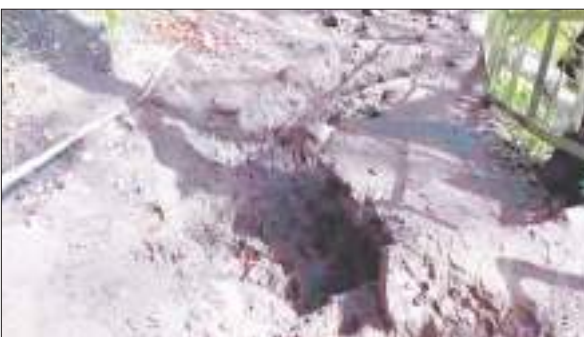
आज इस मार्ग की स्थिति बेहद खराब है। घोड़े-खच्चर चालकों के अनुसार पैदल मार्ग अनेक स्थानों पर बहुत ही खतरनाक और बड़े-बड़े स्टेप सीढ़ियां हैं। कई जगह गड्ढे भी हो रहे हैं। इसकी वजह से कई घोड़े खच्चर तो चढ़ने में ही हांपने