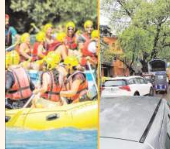
पर्यटक नेपाली फार्म होते हुए श्यामपुर बाइपास, स्व. इंद्रमणि

ऋषिकेश/टीएम एक्शन इंडिया योग नगरी ऋषिकेश में बुधवार को पर्यटकों की भीड़ उमड़ पड़ी। इससे नेपाली फार्म से लेकर तपोवन तक वाहनों का लंबा जाम देखने को मिला। भीड़ को नियंत्रित करने के लिए स्थानीय पुलिस प्रशासन को जगह-जगह रूट डायवर्ट करना पड़ा। पर्यटकों की भीड़ के चलते होटल और कैम्प फुल हो गए। बुधवार सुबह से ही लक्ष्मण झूला, स्वर्गाश्रम, मुनिकीरी, तपोवन और ऋषिकेश मुख्य बाजार में पर्यटकों की आवाजाही शुरू हो गई। पर्यटकों की भीड़ देख स्थानीय पुलिस प्रशासन ने रूट डायवर्ट कर दिया। इसके चलते हरिद्वार से आने वाले