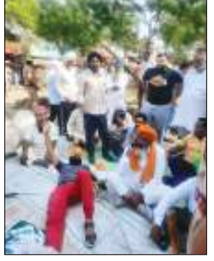
मार्ग एवं सड़कें जाम करने का ऐलान किया है। अंबाला में भी शहीद भगत सिंह ने आज बड़ा कदम उठाने की चेतावनी दी है। किसान नेताओं का कहना है कि

टीम एक्शन इंडिया/अंबाला छावनी (मनीष कुमार) पुलिस द्वारा लाठीचार्ज करने के बाद मंगलवार रात को अंबाला के साहा चौक पर बैठे किसानों को पुलिस ने खदेड़ दिया था। उसके बाद रात को साहा-अंबाला, साहा-शाहाबाद, साहा-पंचकुला और साहा जगाधरी मार्ग को जाम कर दिया। आज सुबह धरनास्थल पर पहुंची पुलिस ने किसानों को खदेड़ दिया। यही नहीं, कई किसानों को हिरासत में भी लिया गया है। वहीं, किसानों पर हुए लाठीचार्ज के बाद साही किसान संगठन एकजुट हो गए हैं। भारतीय किसान यूनियन (चट्टनी ग्रुप) के आह्वान पर किसानों ने आज प्रदेशभर में मुख्य