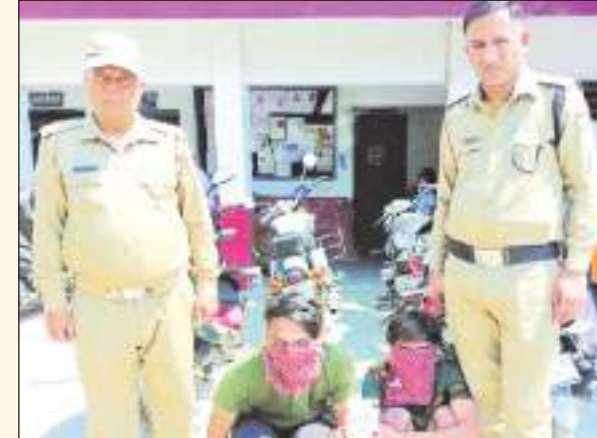
निवासी बड़वांड थाना बटवाडा, मध्य प्रदेश हाल निवासी मंडी