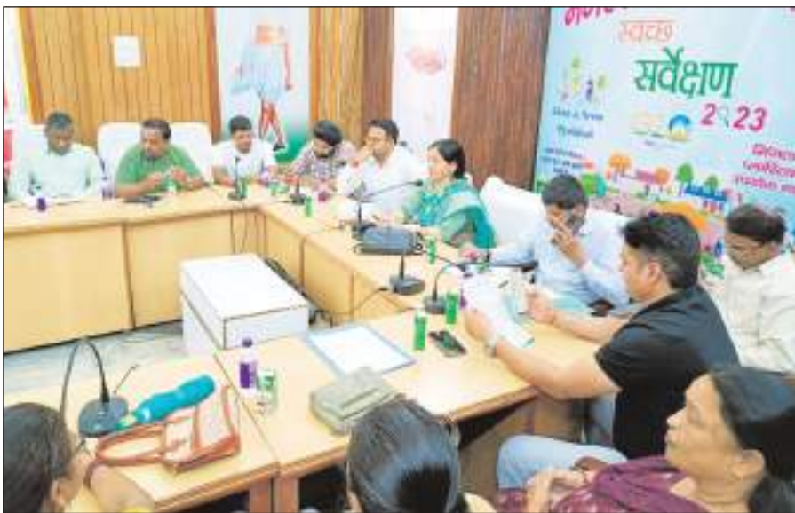
दाईं से करोड़ रुपये के बजट के साथ 150 स्वच्छता कर्मचारियों की मांग प्रशासन से की गई है।